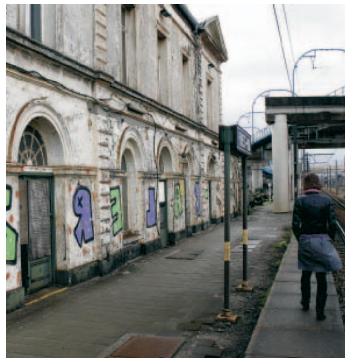
Cachée entre l'usine Audi et la station d'épuration.

L'appel au secours semble avoir été entendu. La pétition, signée par 200 personnes, sera remise dans les prochains jours à la Commission royale des monuments et sites. "Il nous faut 150 signatures pour que la pétition soit valable et recevable. Après cela, il y a une longue procédu-