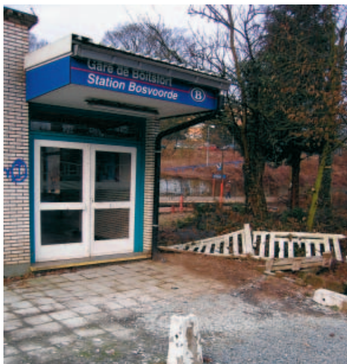
20 jours ouvrables de chantier.

Ce très vieux bâtiment est totalement délabré, tagué et source de danger pour les riverains. Cela fait des mois que la commune fait tout pour que cette destruction se fasse au plus vite. "Nous constatons régulièrement des actes de vandalisme aux abords de la gare et sur les quais", explique Xavier Baeselen (MR), député bruxellois et échevin des Finances de Watermael-Boitsfort. Il rappelle que sur place, la sécurité est une priorité.