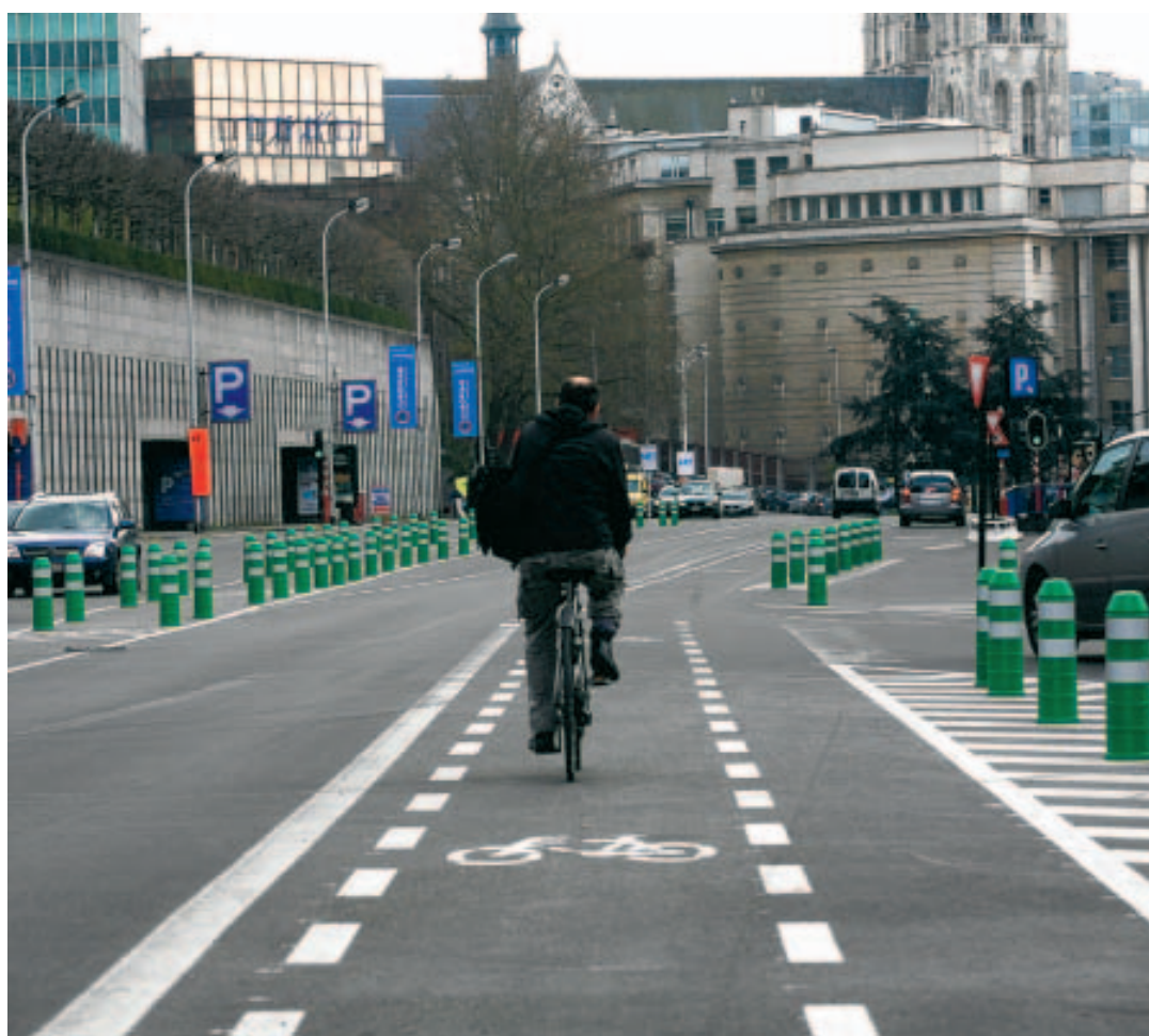
Pour Pacheco, réasphaltage et création d'un rond-point sont au programme.

>Rue Philippe de Champagne. Ici aussi, il s'agit d'un réaménagement complet. Avec utilisation